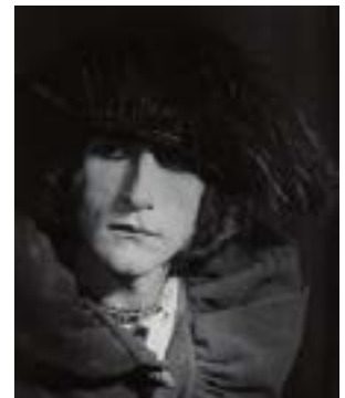
Man Rays porträtt av Marcel Duchamp som Rose Sélavy (1921) kan ses i Umeå.

sedan dess gått från att vara en marginell till en central konstform, och till höstens 10-årsjubileum bjuder Malmöstudion in till "tio högst annorlunda performance-middagar av 5 älskade konstnärer ur Liliths historia". Middagskonceptet får konstnärerna tolka precis som de vill.