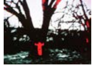
Stilbild ur 16 mm-filmen "Energy charge", 1975.