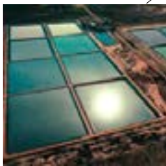
"Bending to earth", 2015.