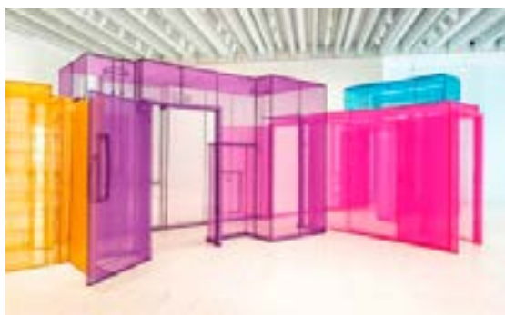
Do Ho Suhns installation "Passager".

nären och filmaren Amar Kanwar, som på flera sätt hakar i dadaisternas såväl poetiska som samhällskritiska hållning. "The sovereign forest" består av flera delar, där huvudverket "The scene of crime" är en 42 minuter lång film.