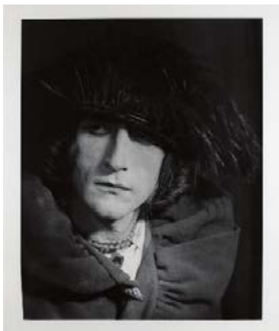
Man Rays porträtt av Marcel Duchamp som sitt kvinnliga alter ego Rose Sélavy, 1921. Foto: Man Ray