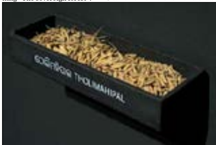
THE SEED ROOM. Detalj.

mikulor och targas mot flyende bybor. I enstaka meningar berättar en kvinna fragmentariskt historien om en försvunnen älskad