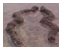
Stilbild ur videon "Ochún", 1981.

Det är starkt och vackert, och som i många av verken med en rörelse mellan det befintliga och ett försvinnande, en övergång från ett tillstånd till ett annat. Magi, riter, den kubanska Santéarieligionen och Yaruba återfinns som grundelement – okända ingredienser i hennes nordamerikanska kontext och säkert en av anledningarna till att det tog sådan tid för henne att inkluderas i "samtidskonsten".