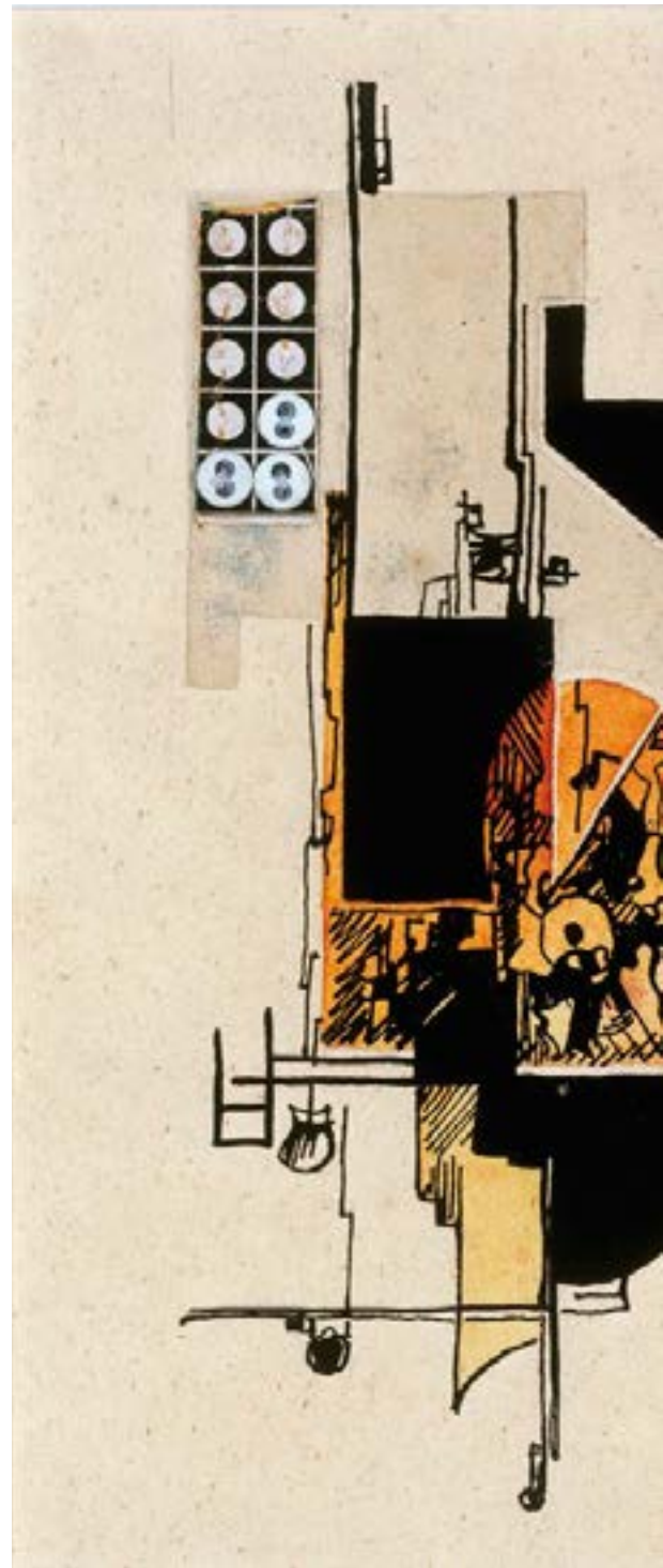
Hannah Höchs "Abstrakt komposition med knappar", 1918.

I Zürichkretsen ingick även den unge Tristan Tzara, som några år senare i Paris anslöt sig till surrealisterna och gifte sig med svenskan Greta Knutson. Hon räknas till sur-