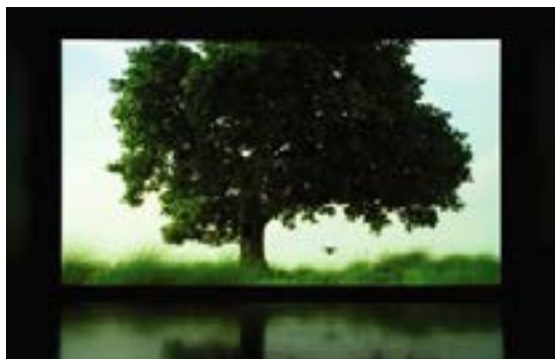
Stillbild ur Amar Kanwars "The scene of crime", 2011.