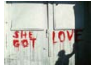
Ovan: Stilbild ur super 8-filmen "Blood writing", 1974. Nedan: Stilbild ur Super 8-filmen "Sweating blood", 1973.