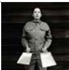
"The cleaner", 2009.

Serbiskan Marina Abramovic har sedan 70-talet arbetat med performance som tänjer konstens gränser. Moderna i Stockholm gör nu hennes första betydande retrospektiv i Europa, med verk om kropp och tid, förlust och minne, makt och hierarkier. Hon gör även ett körverk för Skeppsholmskyrkan.