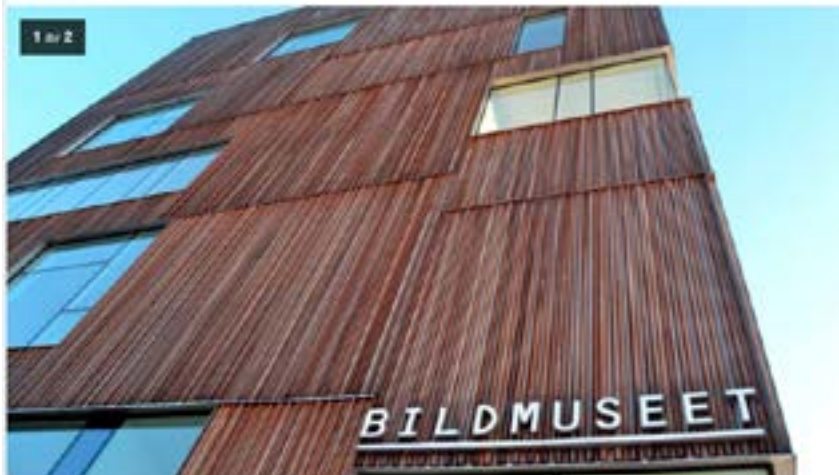
Bildmuseet.