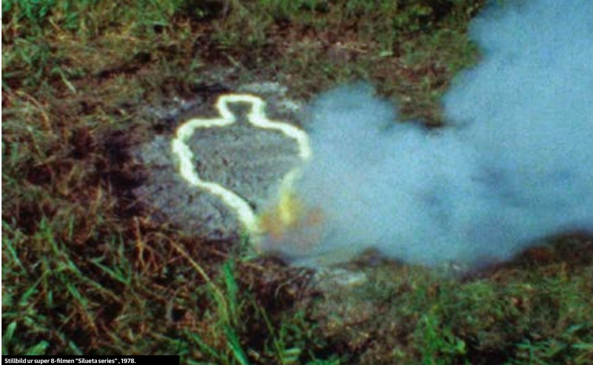
Stilbild ur super 8-filmen "Silueta series", 1978.